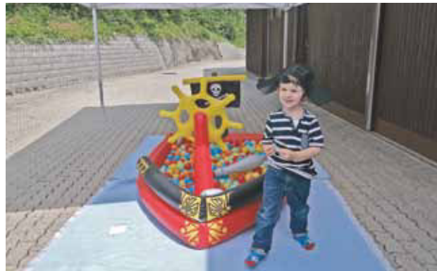
Der kleine Pirat hat soeben im Piratenschiff ein kleines Geschenkli gefunden.