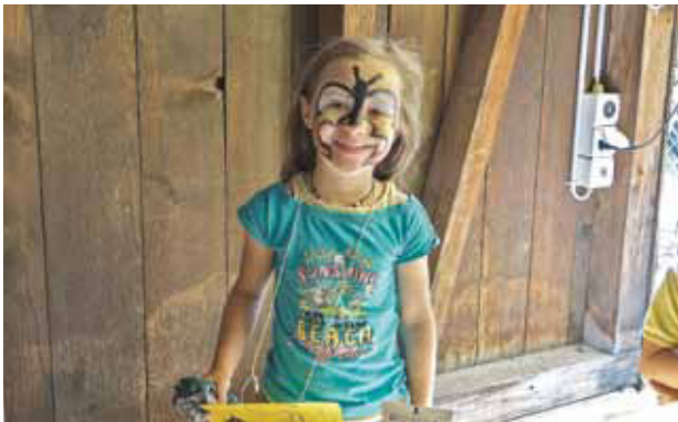
Ich will kein Pirat sein, mir gefällt der Schmetterling viel besser.