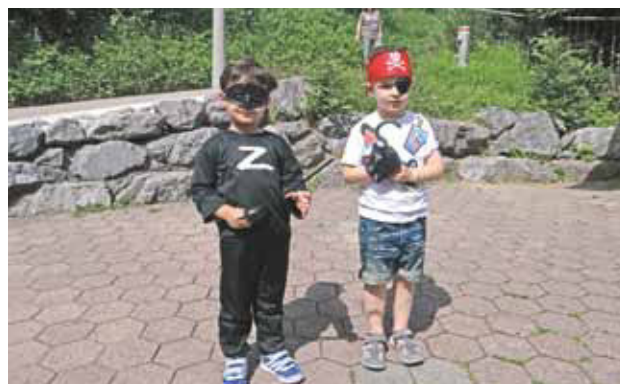
Der einäugige Pirat mit Zorro.